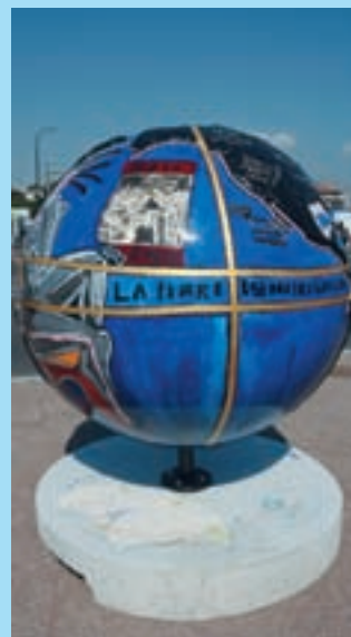
COOL GLOBES MARSEILLE 2010 par : SKUNK DOG

La première édition, à Marrakech, avait attiré environ 500 participants. À La Haye, en 2000, ils étaient 6 000. Trois ans plus tard, à Kyoto, plus de 20 000 professionnels, décideurs, élus, représentants d'organisations internationales et non gouvernementales, s'étaient rassemblés. Ils étaient aussi nombreux à Mexico, en 2006, et plus de 25 000 à Istanbul, au mois de mars 2009, où des représentants de quelque 180 pays se sont retrouvés et où pour la première fois, un sommet de chefs d'états a été organisé.