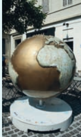
COOL GLOBES MARSEILLE 2010 par : PEYRO