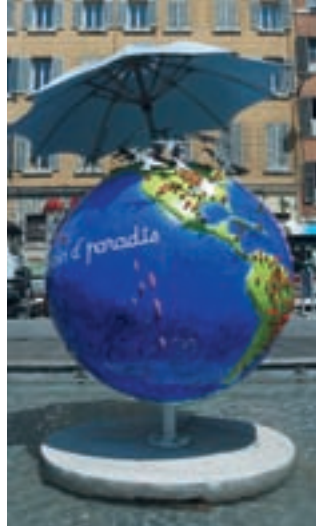
COOL GLOBES MARSEILLE 2010 par : Robert CHAVEAU