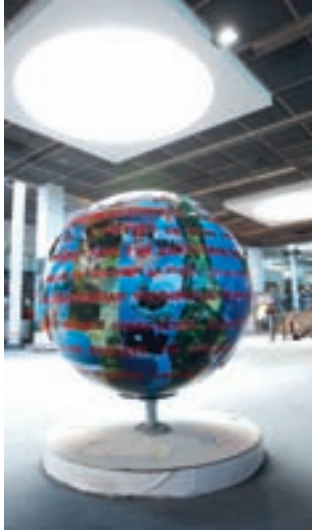
COOL GLOBES MARSEILLE 2010 par : Cécile GUIDONI BOUZAT - C.G.B.