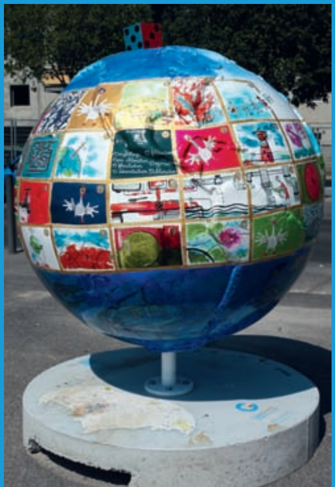
COOL GLOBES MARSEILLE 2010 par : Le Collectif BAL

Le Grenelle de l'Environnement au niveau national, les « Parlements de l'eau » dans chaque bassin hydrographique, ou encore les Comités d'intérêt de quartier à Marseille constituent autant de preuves de la vitalité, de l'esprit d'ouverture et de la capacité d'échanges qui caractérisent la vie de l'eau en France et en Provence.