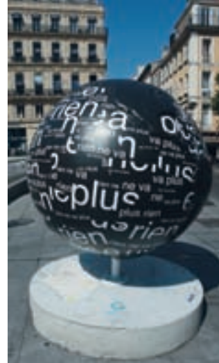
COOL GLOBES MARSEILLE 2010 par : Laurent PIQUET