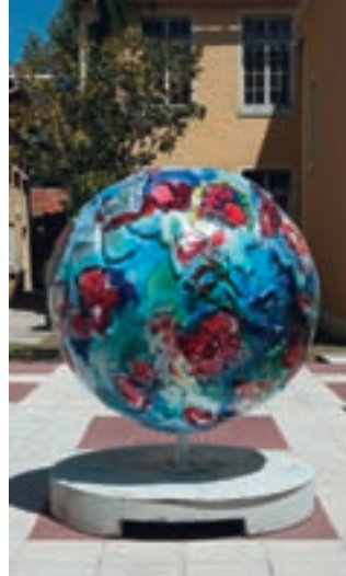
COOL GLOBES MARSEILLE 2010 par : Olivier BERNEX