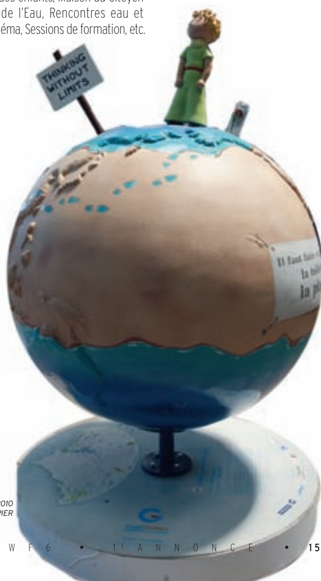
COOL GLOBES MARSEILLE 2010 par : Guy TEMPIER

Les événements et manifestations ont déjà été initiés lors du kick-off meeting à Marseille et se dérouleront tout au long de 2011 afin de connaître une montée en puissance lors de la tenue du Forum.