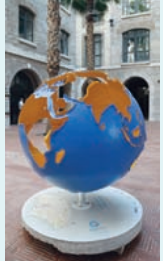
COOL GLOBES MARSEILLE 2010 par : Christophe CASTELLORIZIOS