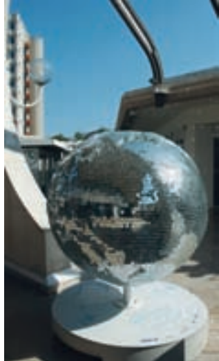
COOL GLOBES MARSEILLE 2010 par : L'ARTMADA