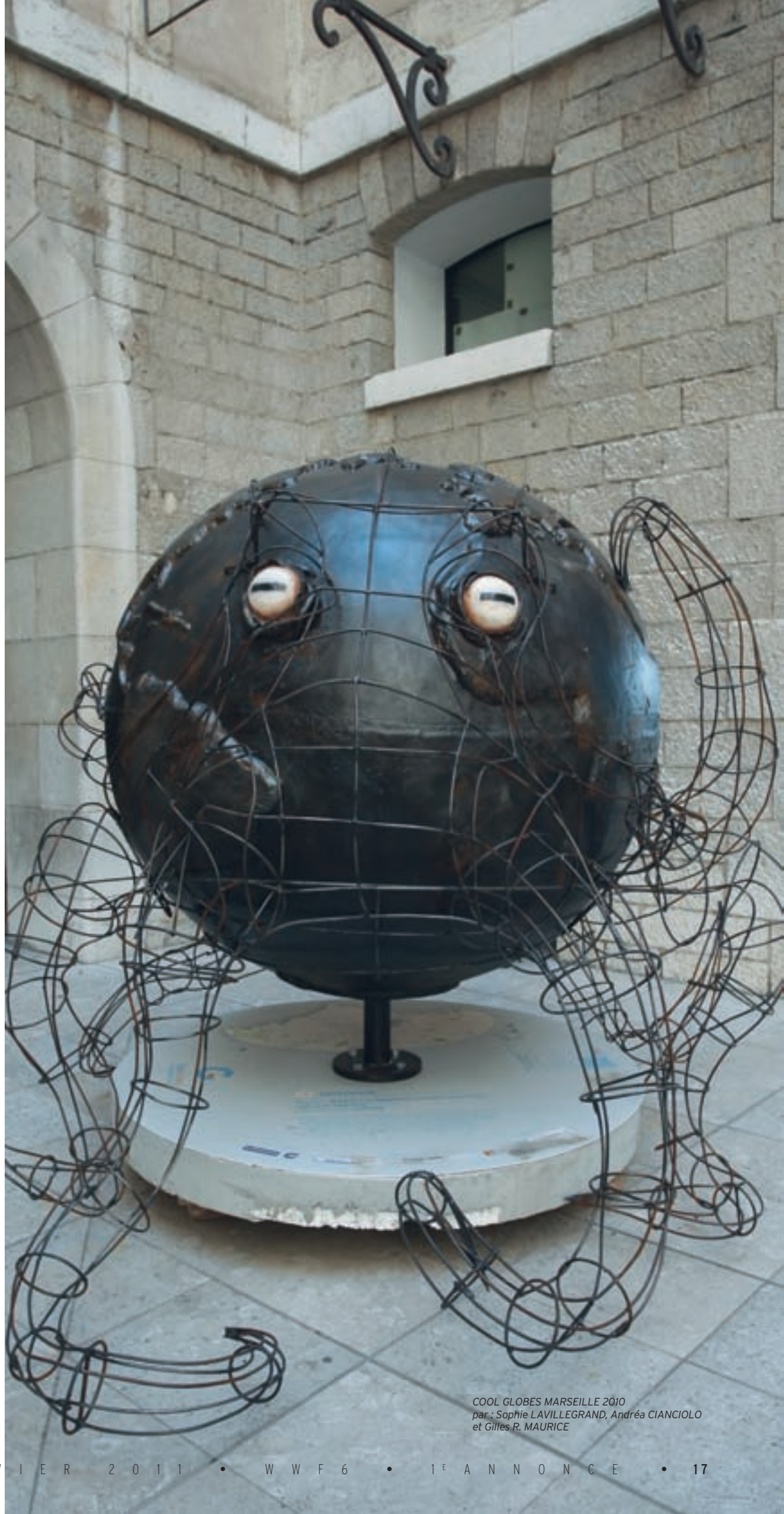
COOL GLOBES MARSEILLE 2010 par : Sophie LAVILLEGRAND, Andréa CIANGIOLLO et Gilles R. MAURICE