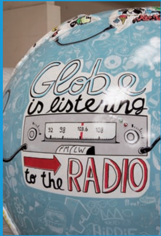
COOL GLOBES MARSEILLE 2010 par : Ecole Intuit-Lab

Siègent actuellement à ce Conseil, des organisations du Maroc, d'Algérie, de France, de Turquie, d'Ouzbekistan, d'Égypte, du Nigeria, du Japon, d'Afrique du Sud, des États-Unis, du Brésil, ou encore du Mexique ou de la Corée du Sud.