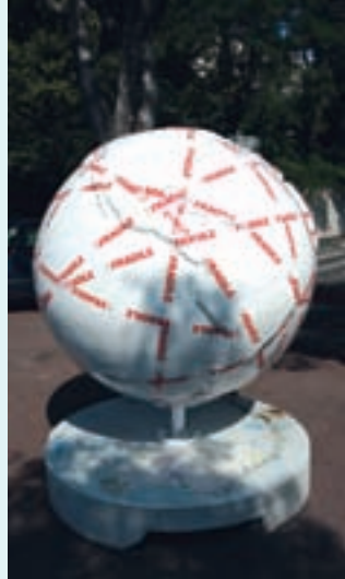
COOL GLOBES MARSEILLE 2010 par : Christophe CASTELLORIZIOS