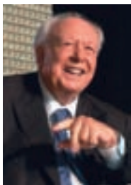
Jean-Claude Gaudin VICE-PRESIDENT DU SENAT MAIRE DE MARSEILLE

Le 6 e Forum Mondial de l'Eau s'engage à traiter les grands problèmes auxquels sont confrontés les pays développés ou en développement du monde entier. Notre slogan « le temps des solutions » est très simple, court et direct. Depuis très longtemps nous diagnostiquons des problèmes tels que ceux décrits cidessus. Or, aucune solution ne peut intervenir sans un bon diagnostic. Les précédents forums ont produit une impressionnante somme d'informations sur les problèmes de nos sociétés et leurs rapports à l'eau. L'heure des solutions est arrivée. Il est temps de faire intervenir des professionnels de différents secteurs ensemble avec les décideurs et de débattre des voies du futur dans un esprit ouvert et convivial. Nous avons besoin de l'engagement de toutes les parties prenantes. Les gouvernements jouent certes un rôle très important pour solutionner nos problèmes pressants, mais l'heure est venue d'impliquer également le secteur privé, les organi-