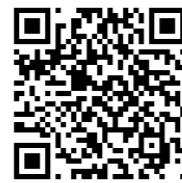
Mobile apps of the programme Applications mobiles du programme