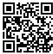
Detailed programme in English