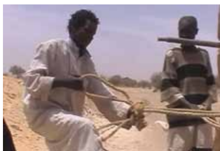
Goutte d'or – Prix Suez environnement « Au centre de la Terre des puits et des hommes » Ingrid Patteta France (2008) 25 min

Istanbul, Œuvres audiovisuelles de moins de 60 minutes