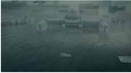
Prix Ouranos « Changement climatique » « Het verloren land » Jos de Putter Pays-Bas (2007) 55 min