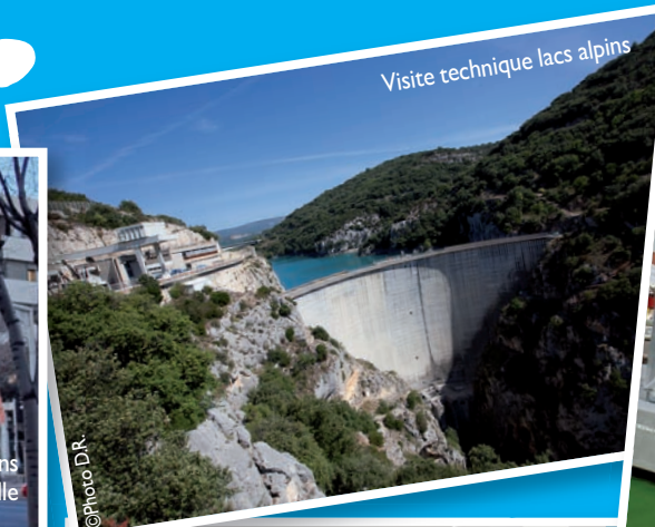
Visite technique lacs alpins