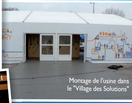
Montage de l'usine dans le "Village des Solutions"