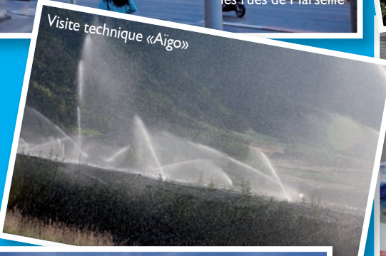
Visite technique «Aigo»