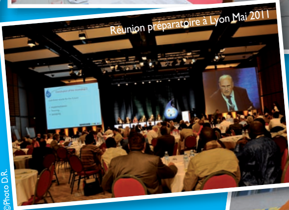
Réunion préparatoire à Lyon Mai 2011