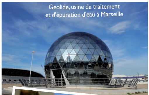
Geolide, usine de traitement et d'épuration d'eau à Marseille