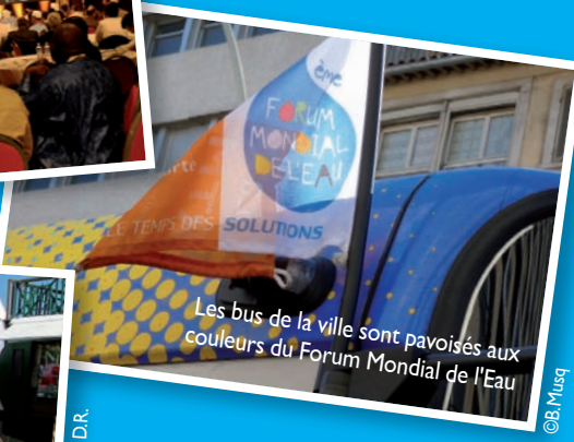
Les bus de la ville sont pavoisés aux couleurs du Forum Mondial de l'Eau