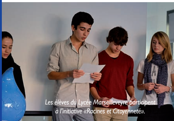
Les élèves du Lycée Marseilleveyre participent à l'initiative «Racines et Citoyenneté».

L'eau n'est pas qu'une affaire de gouvernements, de collectivités, d'entreprises ou de scientifiques. Les citoyens ont aussi leur mot à dire. Ils ne s'en privent pas sur ce 6ème Forum, comme le démontre l'engouement suscité par le projet "Racines et Citoyenneté".