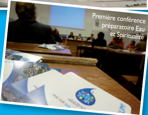
Première conférence préparatoire Eau et Spiritualité