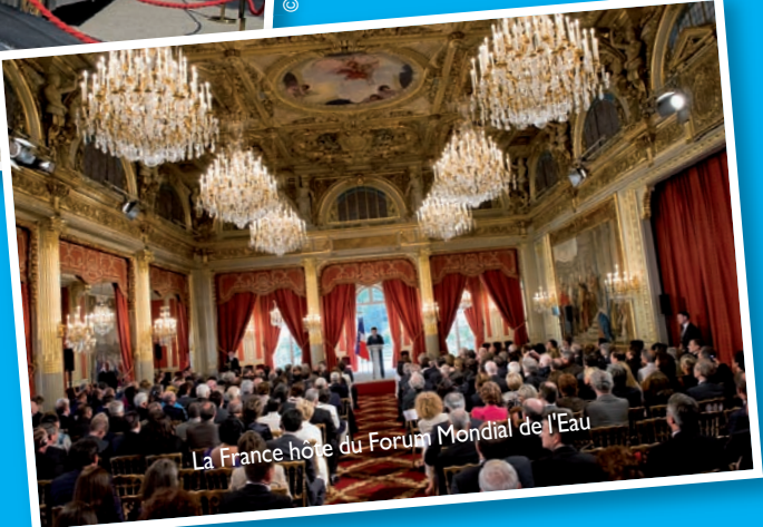
La France hôte du Forum Mondial de l'Eau