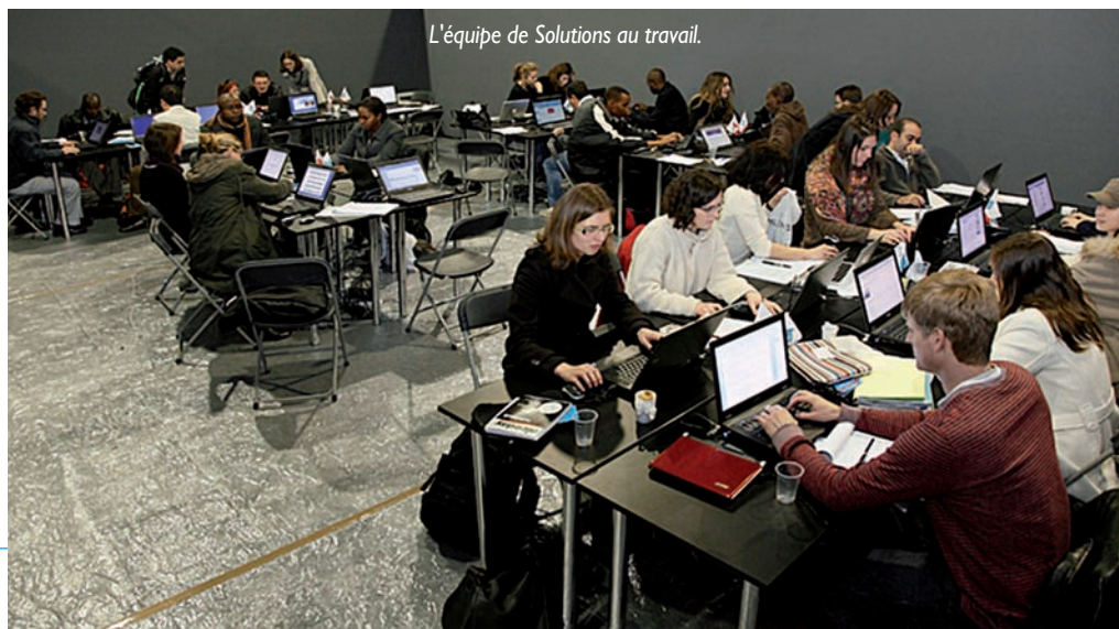
L'équipe de Solutions au travail.