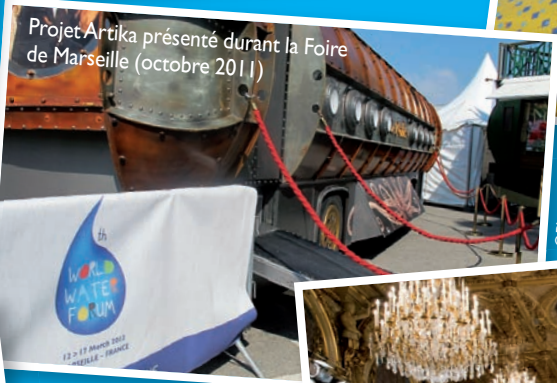
Projet Artika présenté durant la Foire de Marseille (octobre 2011)