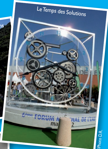
Le Temps des Solutions