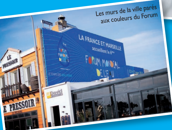
Les murs de la ville parés aux couleurs du Forum